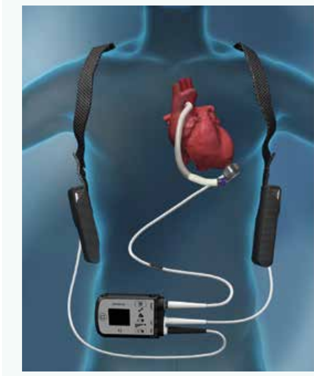
Obr | Mechanická srdeční podpora HeartMate 3