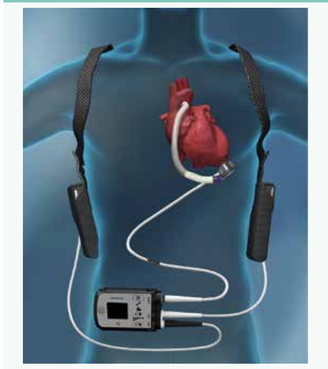
Schéma | Vliv implantace mechanické srdeční podpory (Heart Mate II nebo 3) a cévních parametrů (pulztilního indexu v karotických tepnách a augmentačního indexu) na klinické příhody (median sledování 27 měsíců)